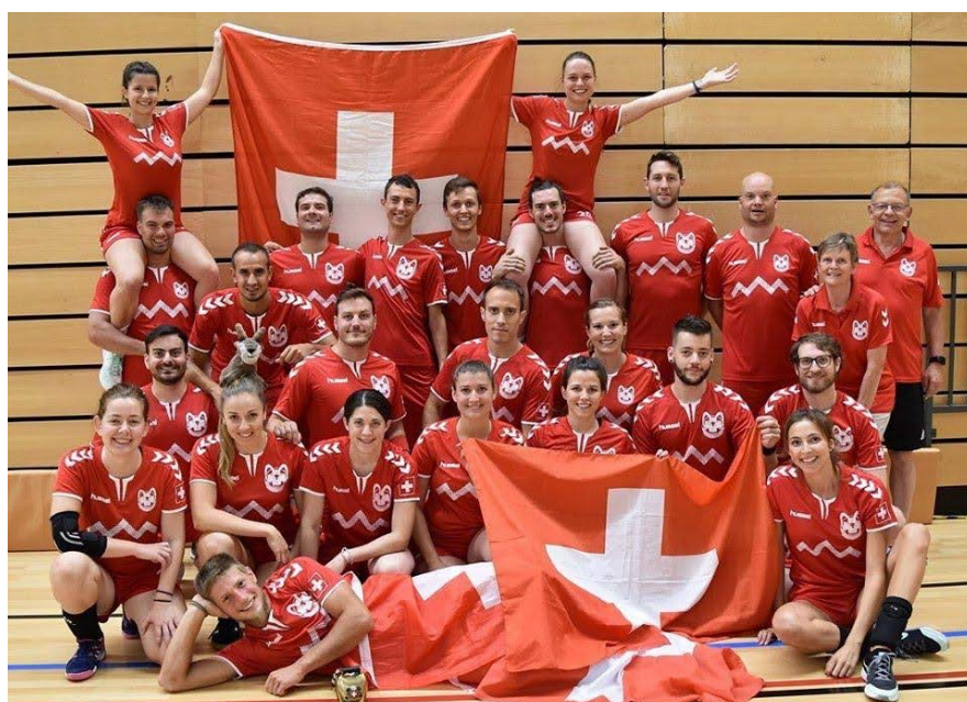
Équipe lors du Championnat d'Europe 2019

Si la Suisse reste une petite équipe sur le plan international, elle est en nette progression et c'est aussi par son sérieux, ses qualités de fair-play et d'ouverture, ainsi que son niveau d'arbitrage que notre sélection est appréciée, respectée et reconnue.